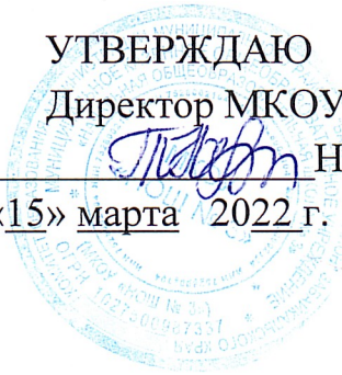
График приема граждан для регистрации заявлений и документов о зачислении в 1 класс на 2022/2023 учебный год в МКОУ «НОШ № 3»